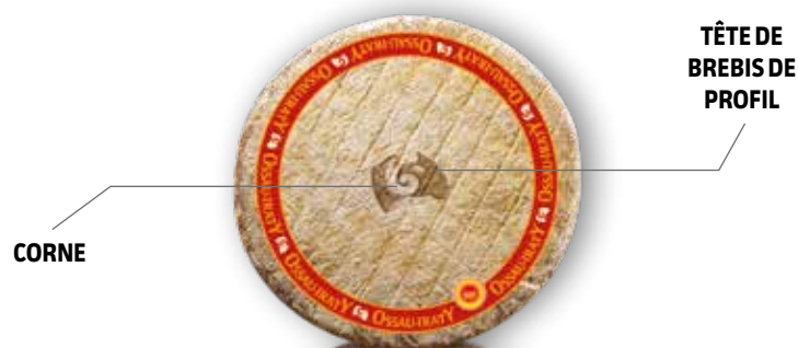
Fromage Ossau-Iraty laitier

Les fromageries fabriquent majoritairement de l'Ossau-Iraty au lait thermisé. Le lait est collecté sur plusieurs exploitations.