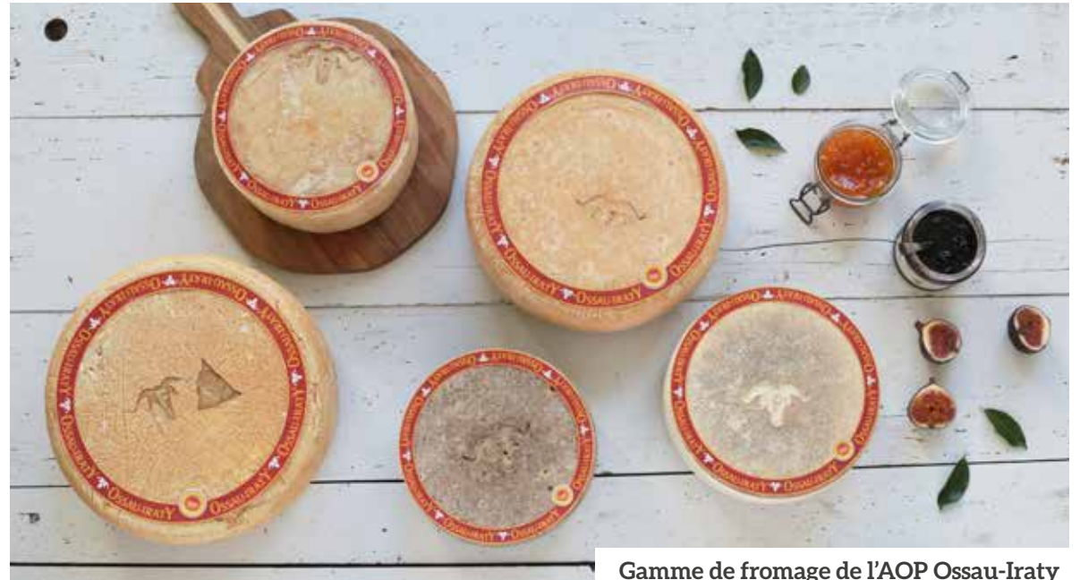
Gamme de fromage de l'AOP Ossau-Iraty

Leur texture est plus ample, ronde, soyeuse, beurrée, fondante et lisse . Leurs arômes sont plus intenses et sont plus typés que les Ossau-Iraty d'hiver ou de printemps. Fraîcheur et corps s'équilibrent au travers d' arômes floraux, végétaux, ou de fruits frais (anis, réglisse, thym, gentiane, agrume, ananas, herbe sèche et/ou herbe fraîche) pour la fraîcheur et des arômes de fruits secs (noix noisettes) et animaux (brebis, laine, laine mouillée, aire de repos) pour le corps et l'amplitude.