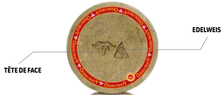
Fromage Ossau-Iraty fermier d'estive

Qu'ils soient produits au Pays Basque ou en Béarn, les fromages Ossau-Iraty fermier d'estive possèdent des caractéristiques différentes permettant aux connaisseurs de les reconnaître uniquement à la dégustation.