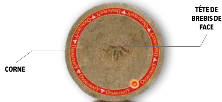
Fromage Ossau-Iraty fermier